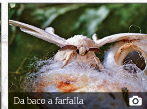
Da baco a farfalla