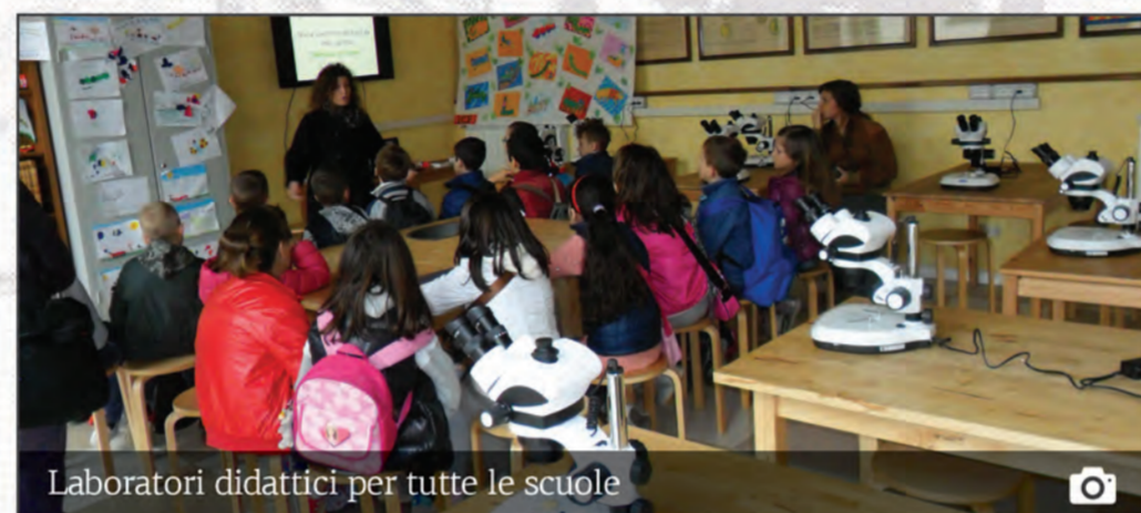
Laboratori didattici per tutte le scuole

Con specifiche attività e linguaggi molto attenti all'età degli studenti e del loro percorso di studi, vengono affrontati i seguenti temi: