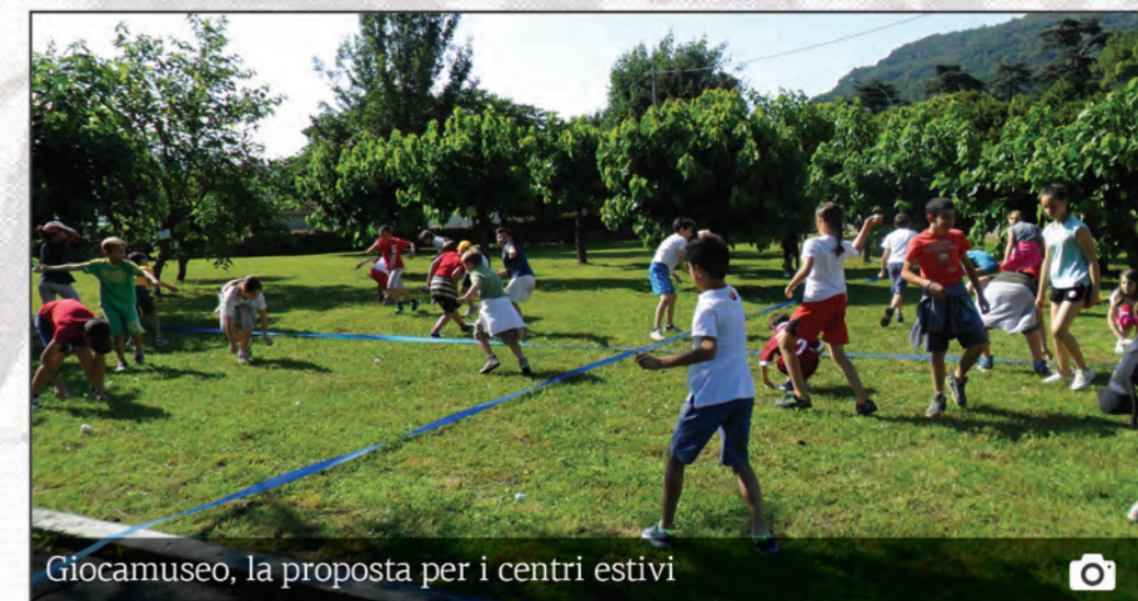
Giocamuseo, la proposta per i centri estivi

Il Museo dispone di spazi all'aperto oltre a un ampio salone utilizzabile in caso di maltempo; il tutto nel verde di uno splendido parco che si affaccia sul lago di Garlate.