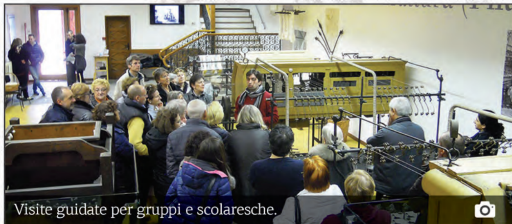
Visite guidate per gruppi e scolaresche.

Le visite guidate hanno una diversa durata (1 ora, 1 ora e mezza o 2 ore) a seconda del grado di approfondimento richiesto. Sono possibili visite di singole persone. Su prenotazione possono essere realizzate visite in lingua inglese, tedesca e spagnola. Nel Museo sono promosse le rassegne B.A.M. (Bambini al Museo) e C.A.M. (Cultura, Arte e Musica al Museo) ogni ultima domenica del mese.